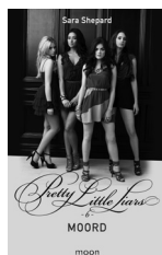
PRETTY LITTLE LIARS 6: Moord ISBN 978 90 448 3603 1