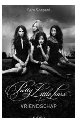
PRETTY LITTLE LIARS 1: Vriendschap ISBN 978 90 448 3566 9