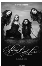
PRETTY LITTLE LIARS 7: Laster ISBN 978 90 448 3608 6