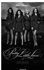
PRETTY LITTLE LIARS 5: Bedrog ISBN 978 90 448 3606 2