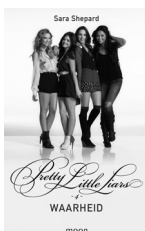
PRETTY LITTLE LIARS 4: Waarheid ISBN 978 90 448 3605 5