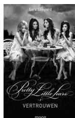
PRETTY LITTLE LIARS 2: Vertrouwen ISBN 978 90 448 3567 6